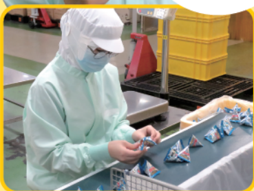
商品の検品にチャレンジ!

先輩方が優しく 丁寧に教えてくれる ので、親しみやすく 楽しい職場です。 ぜひ一緒に 働きましょう!!