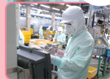
機械の調整にチャレンジ!

仕事に慣れる までは大変だと 思いますが、 焦らず少しずつ 慣れていけば 大丈夫です!