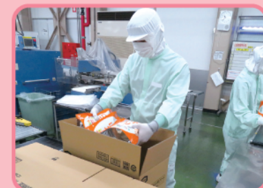
段ボールに商品を入れます