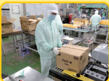
ふうかんき 段ボールを封函機に入れます