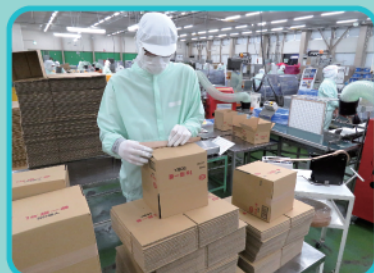
段ボールの組み立てをしています