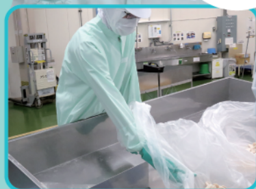
商品を供給します

分からない ことがあっても、 先輩たちが優しく 教えてくれるので 安心して働くことが できます!