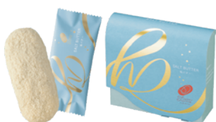
【ハッピーターンズ 塩バター】