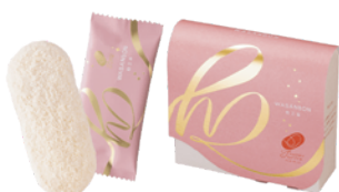
【ハッピーターンズ 和三盆】