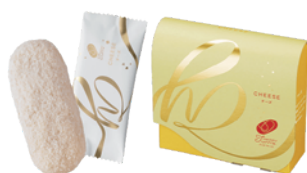
【ハッピーターンズ チーズ】