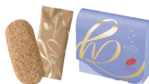
【ハッピーターンズ キャラメルショコラ】