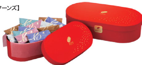
【ハッピーターンズ】

【コンセプト】 たのしいとき、うれしいとき、おいしいとき。どんな人でも笑顔のそばには「ハッピー」があります。そんなハッピーを、食べて、贈って、楽しむことで多くの人へ伝えたい。HAPPY SHOPでうまれた、ちいさく飛び跳ねちゃうくらいのおいしさを新潟からお菓子を通してみなさまへお届けします。