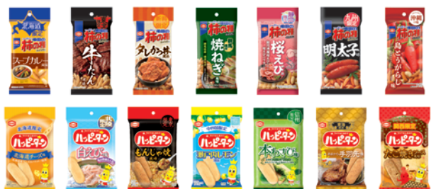
【地域限定商品(一部)】

店内キッチンでは初の「ベイクタイプのハッピーターン」が登場します。ほかにも、ハッピーターンに合うように開発したメニューも販売します。